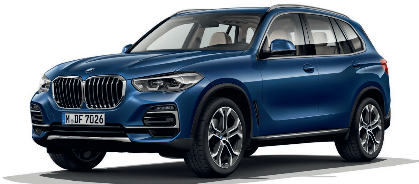
7HW - xLine - BMW X5 xDrive40i, metalický lak Phytomic Blue (volitelná výbava), 21" kola z lehké slitiny Y-spoke 744 (volitelná výbava)