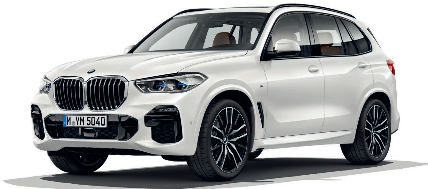
337 - M sportovní paket - BMW X5 xDrive40i, metalický lak Mineral White (volitelná výbava), 22" M kola z lehké slitiny Double-spoke 742 M (volitelná výbava)